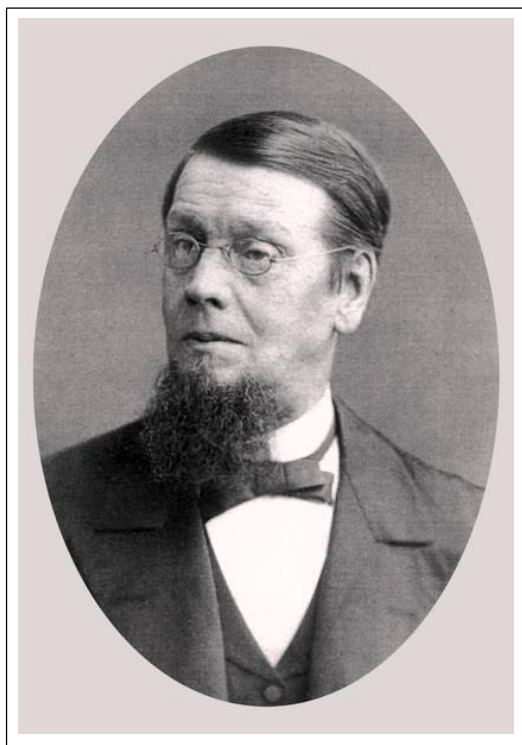
Карл Иванович Май